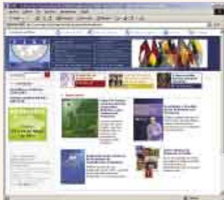
Nuevo sitio web de la FIAP

En el mes de junio, se lanzó el nuevo sitio Web de la FIAP, el cual cuenta con un diseño renovado, nuevas funcionalidades, novedosos contenidos y opera en forma más ágil y atractiva para el usuario.